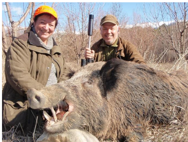
Glade Mylla-kunder med stor galte