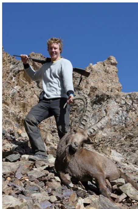
Endelig lønn for strevet!