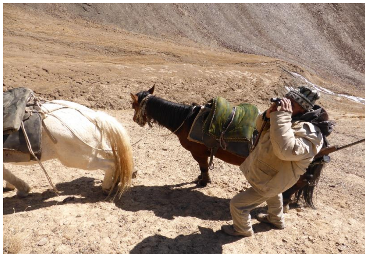
Vi speider omkring i fjellområdene!