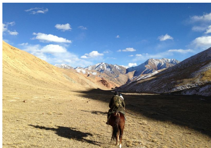
Fantastisk vill natur omgir oss på alle kanter!