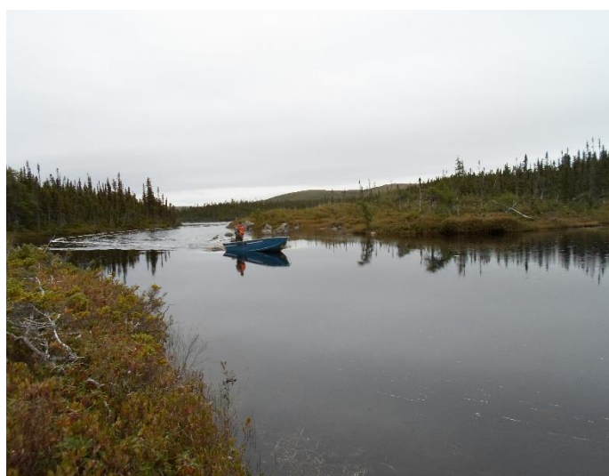
Her er vi på vei ut på jakt