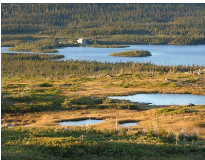
En av våre jaktcamper!