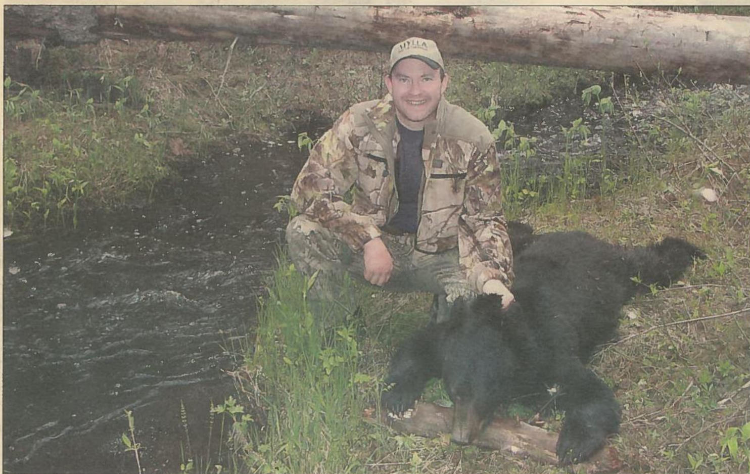
* Svartbjørnen som var seks fot lang. Hallebygda- ren har tinga begge dei to bjørnane av ein taksidermist, og desse vert flotte trofè.

- Det vart opplyst at det er rundt 800.000 svartbjørn berre i Canada, og dei reknar det som eit stort problem at bestanden