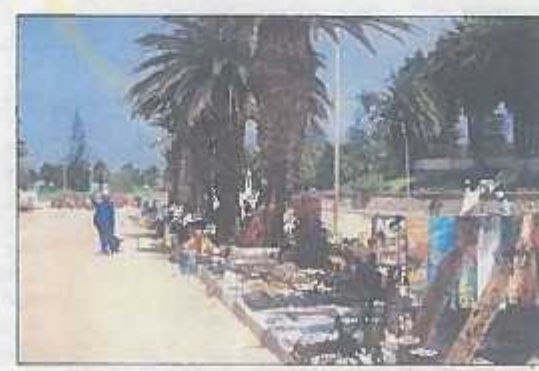
SHOPPING: Shopping i Afrika er ikke helt det samme som i Karl Johan.