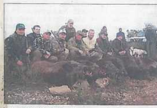
VILLSVINJAKT: En glad gjeng med villsvinjegere i Tunisia